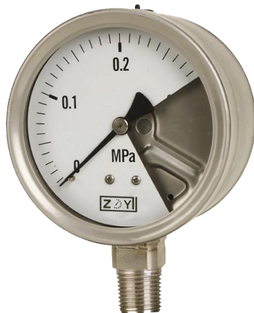
全不锈钢安全型压力表 型号 YTQ-100H